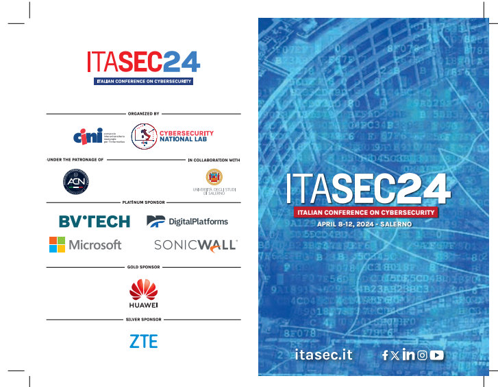
Figure Opportunità per lo Sponsor .1 – Agenda di ITASEC24