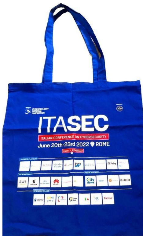
Figure Opportunità per lo Sponsor .3 – Borsa Congressuale ITASEC