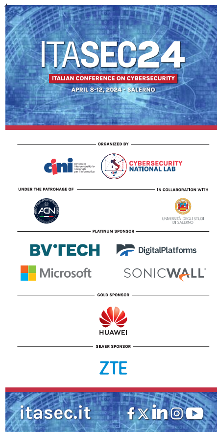
Figure Opportunità per lo Sponsor .2 – Totem di ITASEC24 (cm 100 x 200)