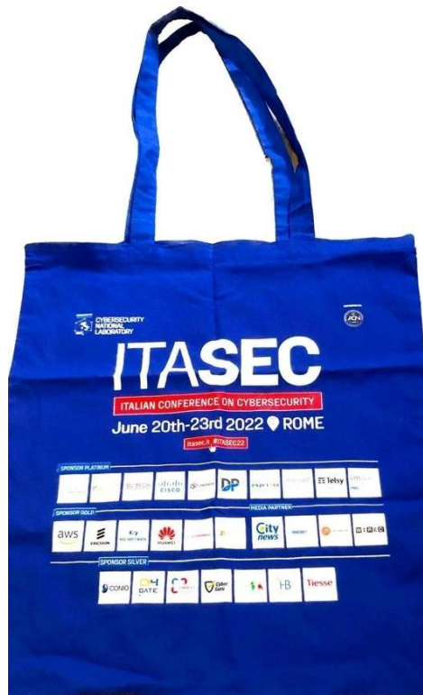
Figure 4.3 – Borsa Congressuale ITASEC