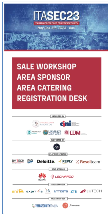
Figure 4.2 – Totem di ITASEC23 (cm 100 x 200)