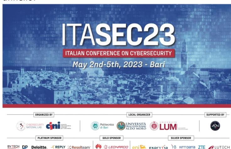
Figure 4.1 – Pannello di ITASEC23 (cm 300 x 200)